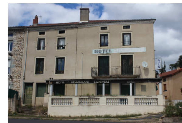
Le café de l'Univers, siège de la Résistance à Retournac.