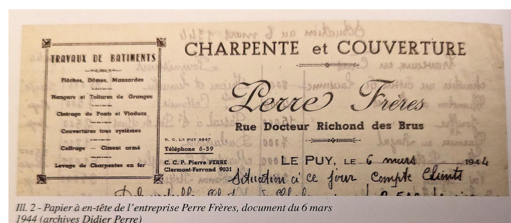
Ill. 2 - Papier à en-tête de l'entreprise Perre Frères, document du 6 mars 1944